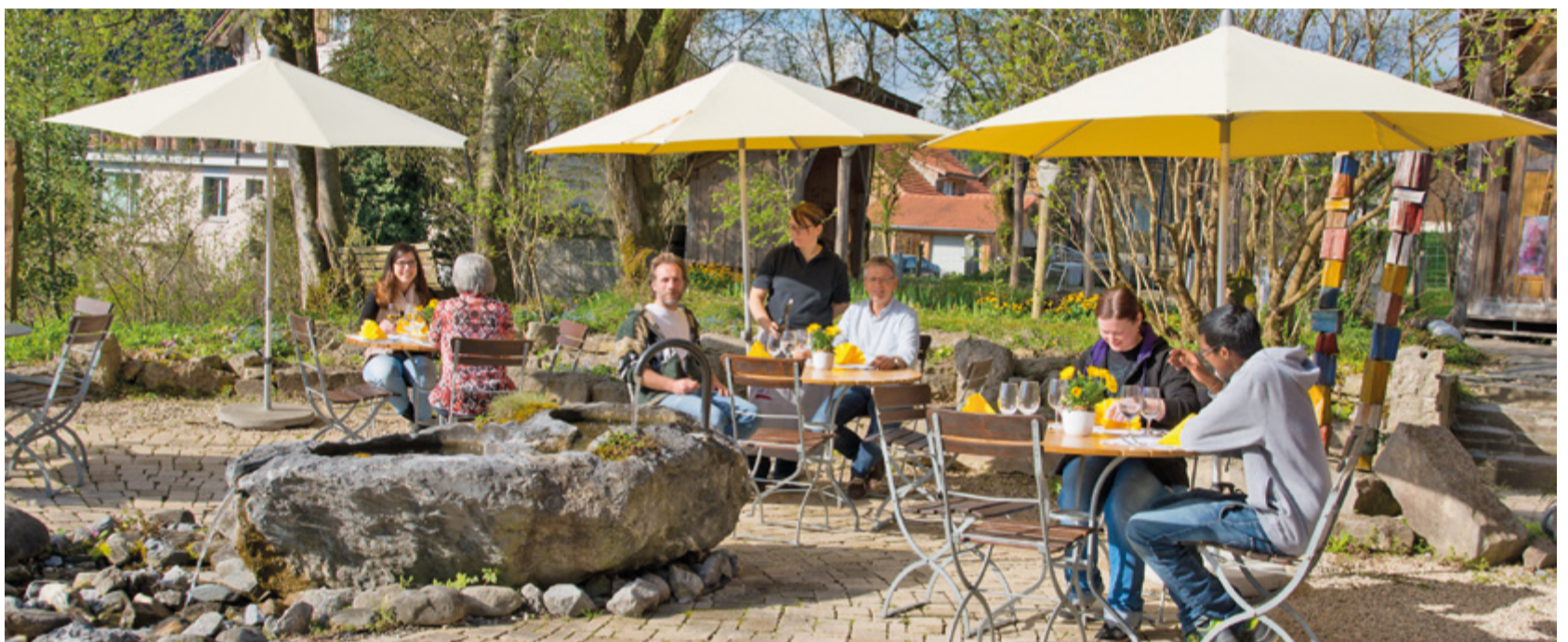
Das KORN.HAUS feiert Jubiläum und lädt die Bevölkerung herzlich zu einem Tag voller Attraktionen und kulinarischem Genuss ein.

Damit sich die Kinder wohl fühlen, stehen verschiedene Spielmög-